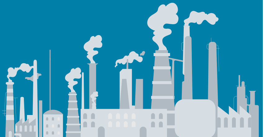
Abbildung 1: CO 2 -Emissionen aus dem Endenergieverbrauch in Sachsen-Anhalt nach Energieträgern

davon Verarbeitendes Gewerbe: 11,89 Mio. Tonnen ≈ 54 %