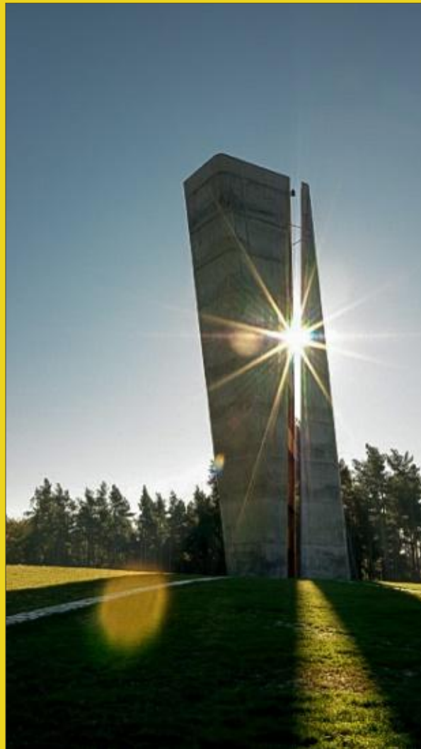
Aussichtsturm am Fundort der Himmelscheibe Erbaut 2007

Jörg Wagner (Landesarbeitsgemeinschaft Jugendkunstschulen Thüringen e.V.) - (angefr.)